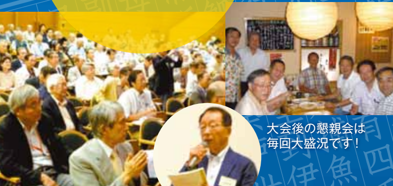
全国大会 in 東京