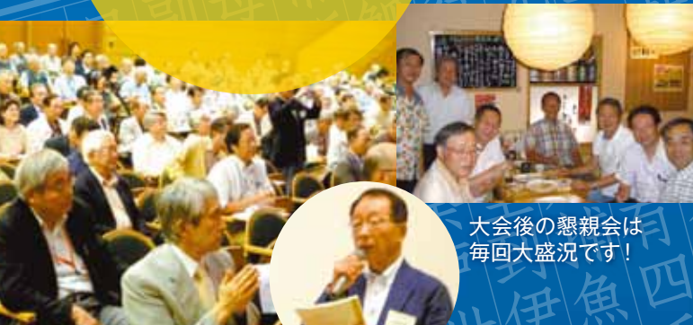
全国大会 in 東京